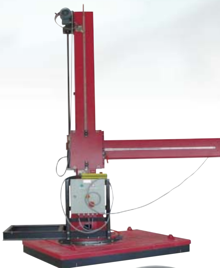
LK 2 x 2