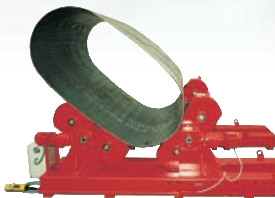
RBZ 10 ovaal

Deze RBZ 10 ovaal is speciaal ontwikkeld voor het roteren van delen voor ovale tanks van tankauto's.